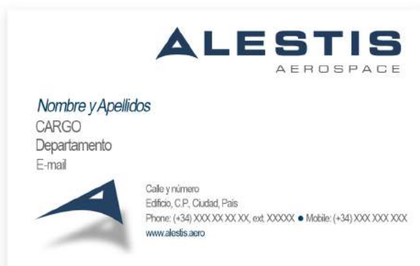
Tarjeta de visita